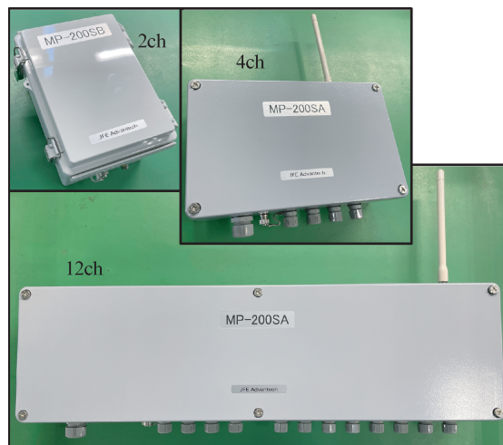
写真 1 無線局ユニット