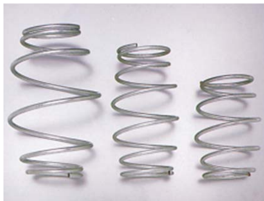
溶融めっきアフタードロ一品