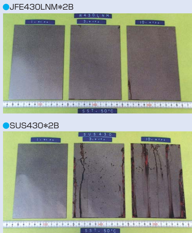
図-2. 塩水の噴霧を受けたときの発錆程度

厨房機器に現在多く使われているSUS430およびSUS430LXに比べ、よりすぐれた輝きとクリーンさを、長期間にわたって保ちます。(図-2)