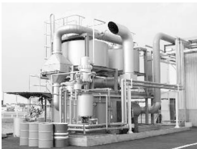
写真2 断熱フロン回収装置

また、当対象家電4品目に定められた再商品化率は、テレビ55%以上、冷蔵庫50%以上、洗濯機50%以上、エアコン60%以上であるが、NKKが実証試験を行っている熱媒浴によるシュレッダーダスト高炉原料化技術を組み合わせることにより、次のステップでは90%以上の再資源化率が可能となる。