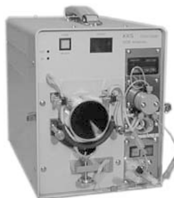
写真 2 COD 分析装置の外観