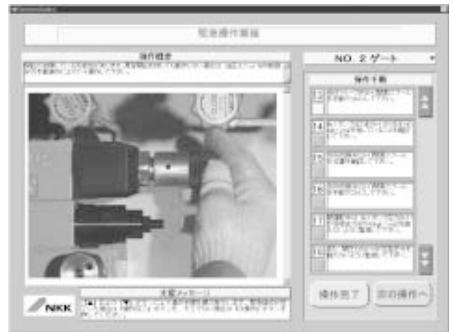
図5 緊急操作支援画面例

検出した故障内容について緊急操作方法が関連付けされており,復旧要領と同様に手順表示は,動画,静止画および音声にて表示される。