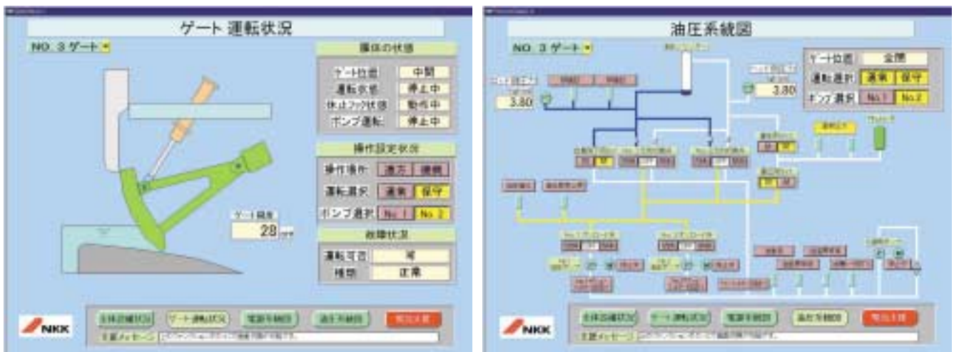
図2 運転状態監視画面例