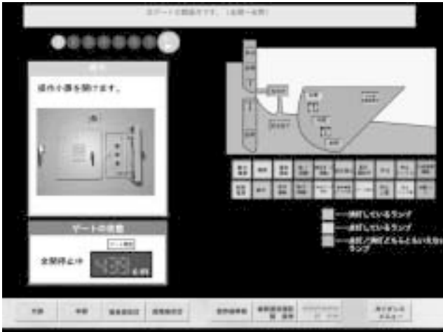
図6 操作ガイダンス画面例