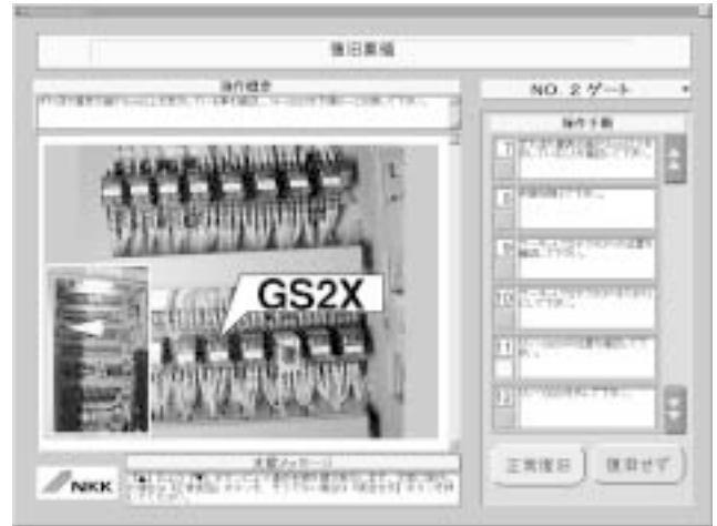
図4 復旧支援画面例

機側操作盤および遠隔操作設備側からの操作指令によりゲート動作が不可能であり,かつ緊急にゲート動作を行わなければならない非常事態には,故障原因を取り除くことなくゲート操作を行う方法を提示する(図5参照)。