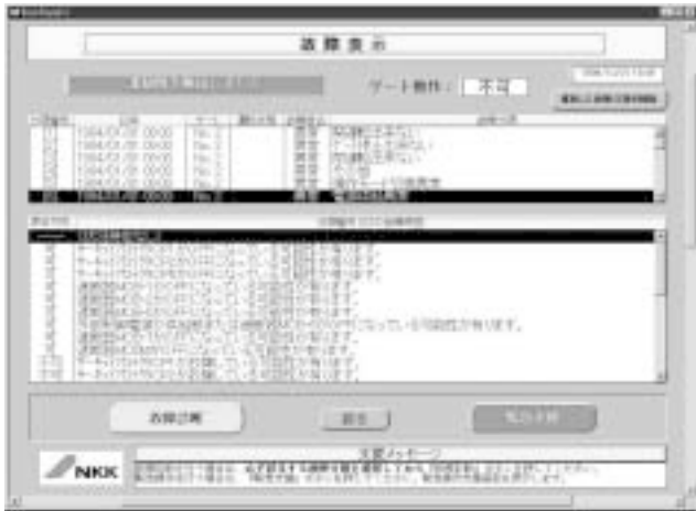
図3 故障検出画面例

故障発生時には発生箇所,発生状態,原因および日時などをパソコン画面上に強制的にポップアップ表示させるとともに音声にて検出を通知させている(図3参照)。