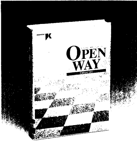
Photo 1 The appearance of OPENWAY Emulator package

逆に Windows アプリケーションのデータをホスト画面の入力フィールドに貼り付けることが可能である。