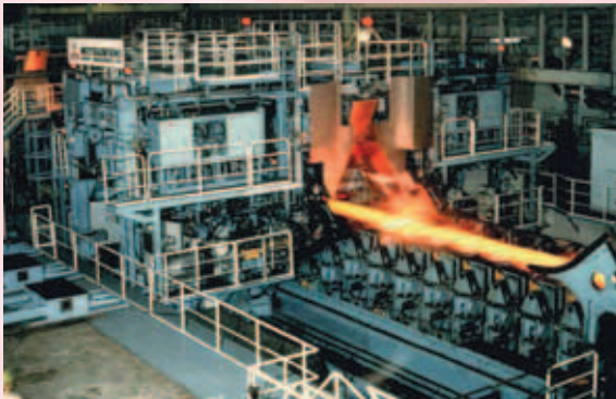
開発した実機設備例（千葉第3熱間圧延工場） 世界初のエンドレス圧延技術でシートバーを接合しながら熱延鋼帯を圧延します。

材質造り込みには、「延ばす、形にする」—圧延技術も不可欠です。圧延負荷・変形特性等の基礎研究とともに、熱処理技術と圧延技術を組み合わせ、全く新しい材質を創生するプロセスの開発等も行っています。