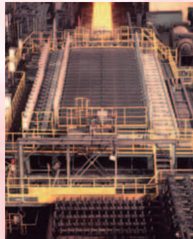
冷却実験(上)と 実機設備 (下、福山厚板工場)

冷却実験等により、安定して高冷却速度を実現するSuper-OLACを開発し、実用化しました。