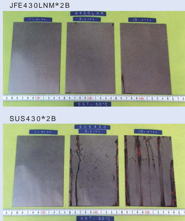
図-2 .塩水の噴霧を受けたときの発錆程度

厨房機器に現在多く使われているSUS430およびSUS430LXに比べ、よりすぐれた輝きとクリーンさを、長期間にわたって保ちます。(図-2)