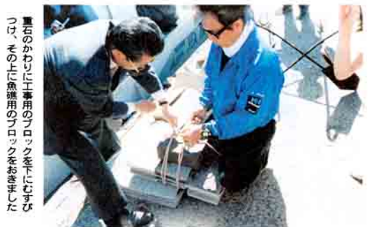
重石のかわりに工事用のブロックを下にむすびつけ、その上に魚礁用のブロックをおきました