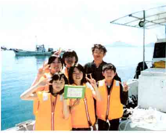
5月に、島の人の協力をえて船で海に出て、ブロックをすずめました...